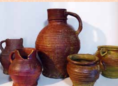
Duinger Steinzeug-Funde aus dem 15. und 16. Jahrhundert. Solche Töpferwaren waren über viele Jahrhunderte weit verbreitet und fanden sich in jedem Haushalt, als Glas noch ein Luxusgut war.